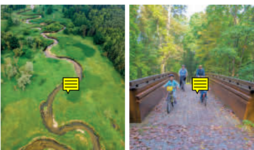
Rzeka Ruda, fot. B. Szaro

GMINA KUŹNIA RACIBORSKA – jest prawie w całości położona na terenie Parku Krajobrazowego Cysterskie Kompozycje Krajobrazowe Rud Wielkich. Tereny leśne w gminie stanowią 70% jej powierzchni, a uroklive meandrująca rzeka Ruda wyznacza os gminy. Gmina ma wybitne warunki dla turystyki kajakowej. Na jej terenie krzyżują się szlaki kajakowe rzek Rudy i Odry, które łączą się ze sobą w miejscowości Turze, gdzie Ruda uchodzi do Odry. Największe atrakcje turystyczne gminy mieszczą się w Rudach (m.in.: Pocysterski Zespół Klastorno-Pałacowy, Zabytkowa Stacja Kolei Wąskotorowej, Park Linowy „Stacyjkowo Rudy”), ale po rozległych obszarach leśnych są poprowadzone liczne szlaki piesze, rowerowe i dydaktyczne, prowadzące do wielu interesujących turystycznie miejsc na mapie gminy. Ciekawą ofertę dla turystów posiada położona w Kuźni Raciborskiej Zagroda Edukacyjna „Kuchnia u Kowala”, organizująca zajęcia z dziedziny ekologii, zdrowego trybu życia, teatru, historii i survivalu.