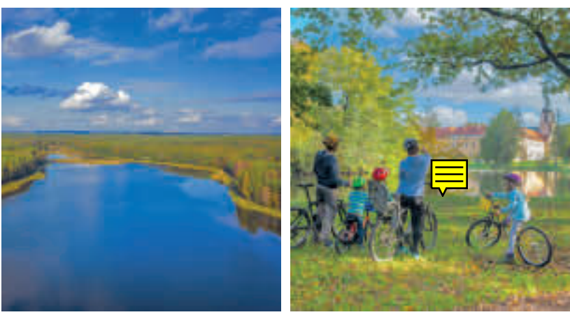
Przejazd Palowickie

PARK KRAJOBRAZOWY CYSTERSKIE KOMPOZYCJE KRAJOBRAZOWE RUD WIELKICH – rozległe tereny leśne z licznymi wodnymi akwenami. Obfitość wód na tych terenach przyczyniła się do znacznego zróżnicowania miejscowej fauny i flory oraz miała znaczenie dla gospodarki rolnej w tych terenach przez cystersów – pracujących zakonników, którzy zakładali stawy i prowadzili na szeroką skalę hodowlę ryb, budowali liczne młyny wodne, drogi, mosty itp. Są to do dziś widoczne w krajobrazie ślady kilkusettletniej obecności cystersów na tym terenie. Liczne akweny wodne stały się miejscem siedliskowym wielu gatunków zwierząt i roślin, a dziś są objęte ochroną przyrodniczą i krajobrazową. Są to między innymi rezerwat leśno-stawowy „Łęczęcz”, stawy „Wielikąt”, tzw. Pojezierze Palowickie , a także ogrody botaniczny Arboretum Bramy Morawskiej w Raciborzu . Najważniejszym świadectwem kulturowego spuścizny cystersów, jest Zespół Klastorno-Pałacowy w Rudach wraz z otaczającym go parkiem. Wszystkie te miejsca są świetnie skomunikowane turystycznie siecią licznych tras pieszych i rowerowych.