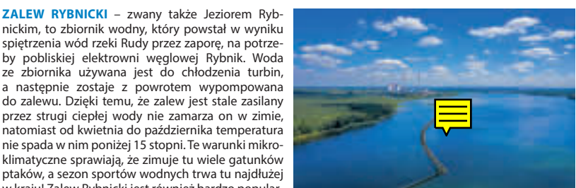
Zalew Rybnicki, fot. M. Giba, Krajna Górnej Odry

GMINA KUŹNIA RACIBORSKA – jest prawie w całości położona na terenie Parku Krajobrazowego Cysterskie Kompozycje Krajobrazowe Rud Wielkich. Tereny leśne w gminie stanowią 70% jej powierzchni, a uroklive meandrująca rzeka Ruda wyznacza os gminy. Gmina ma wybitne warunki dla turystyki kajakowej. Na jej terenie krzyżują się szlaki kajakowe rzek Rudy i Odry, które łączą się ze sobą w miejscowości Turze, gdzie Ruda uchodzi do Odry. Największe atrakcje turystyczne gminy mieszczą się w Rudach (m.in.: Pocysterski Zespół Klastorno-Pałacowy, Zabytkowa Stacja Kolei Wąskotorowej, Park Linowy „Stacyjkowo Rudy”), ale po rozległych obszarach leśnych są poprowadzone liczne szlaki piesze, rowerowe i dydaktyczne, prowadzące do wielu interesujących turystycznie miejsc na mapie gminy. Ciekawą ofertę dla turystów posiada położona w Kuźni Raciborskiej Zagroda Edukacyjna „Kuchnia u Kowala”, organizująca zajęcia z dziedziny ekologii, zdrowego trybu życia, teatru, historii i survivalu.